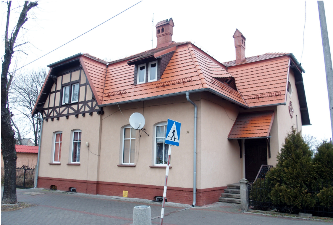
Widok budynku od południowego - zachodu

8. Fotografia z opisem wskazującym orientację albo mapa z zaznaczonym stanowiskiem archeologicznym