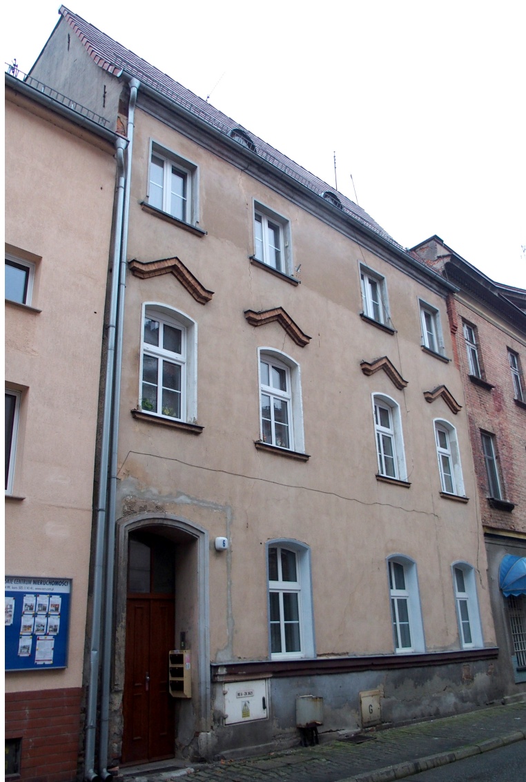
Widok budynku od zachodu

8. Fotografia z opisem wskazującym orientację albo mapa z zaznaczonym stanowiskiem archeologicznym